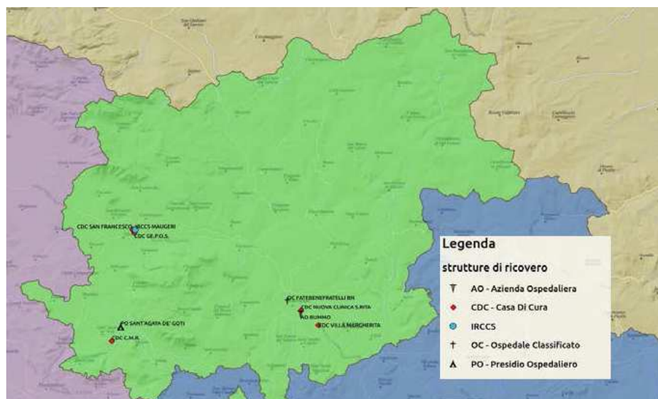
Figura 3. Mappa della Provincia di Benevento